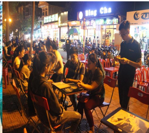
Phương án 2 (ăn ngoài hàng ăn)