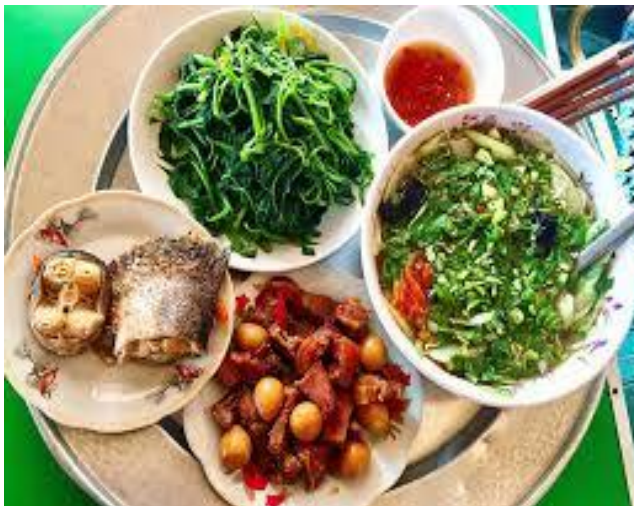
Phương án 1 (tự nấu ăn)

Bạn và một người bạn học cùng thuê nhà ở trọ. Các bạn đang thảo luận xem nên tự nấu ăn (phương án 1) hay ăn ngoài hàng ăn (phương án 2) để có thời gian học hành và nghỉ ngơi. Bạn hãy đưa ra phương án lựa chọn của mình và thuyết phục người bạn đồng ý với phương án mà bạn lựa chọn.